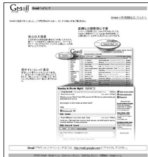
図2 サインアップ完了

図3⑥の「設定」をクリック。設定画面で「メール転送とPOP設定」→POPダウンロードの項目で「全てのメールでPOPを有効にする」をチェック →3番の所にある「設定手順」を参考に開いておき、設定を保存する。先ほど開いたページを参考にし、メールソフトを設定すれば完了♪