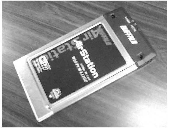
無線 LAN カード